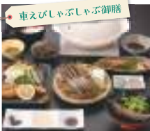
車えびしゃぶしゃぶ御膳

■出発日(2024年)と旅行代金 4月 27(土) 5月 26(日) 6月 15(土)