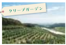
クリーブガーデン

隠れ古刹。習った足利尊氏は間違い。 木像と一緒に初心者向け座禅でスッキリ。 本物のオリーブと美味しい昼食。